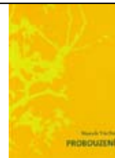
Z knihy Probouzení (2009, Cesta)

„Základní otázkou lékařské etiky je, zda smíme to, co můžeme, – a pokud nesmíme, kdo nám v tom může zabránit, kdo nám má co zakazovat? Bůh, zákony státu, veřejné mínění, svědomí, nebo kdo vlastně? Technicky toho dnes umíme víc a víc a mnohé věci se pro nás stávají proveditelné: například se pomalu spekuluje o klonování člověka a sestavování genetického designu budoucího dítěte na přání rodičů. Ale znovu, smíme to, co umíme? Jinak řečeno, existuje rozdíl mezi technickou nemožností a morální nemožností?“