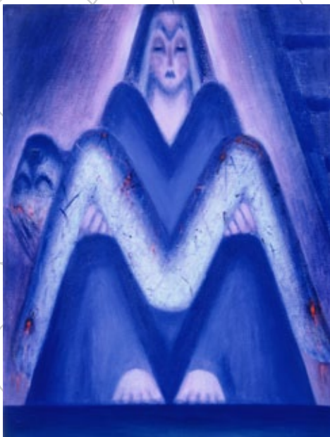
ilustrace: Věra Nováková Brázdová: 'Metamorfózy M'

zašifrovanou výpověď o něčem obecnějším nebo i kosmičtějším.“, komentuje obrazy autorka.