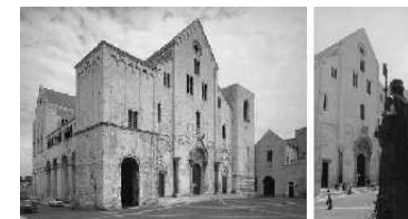
Bazilika sv. Mikuláše v Bari

Narozen: kolem r. 280/286 v Patrasu (Řecko) Zemřel 6. 12. kolem r. 345/351 v Myře, dnes Demre (Turecko). Svátek se slaví 6. prosince.